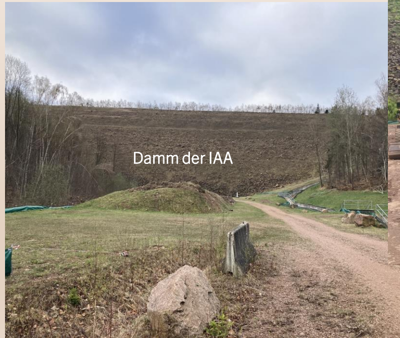
Damm der IAA