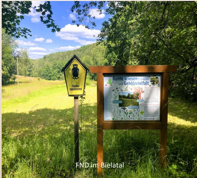
FND im Bielatal