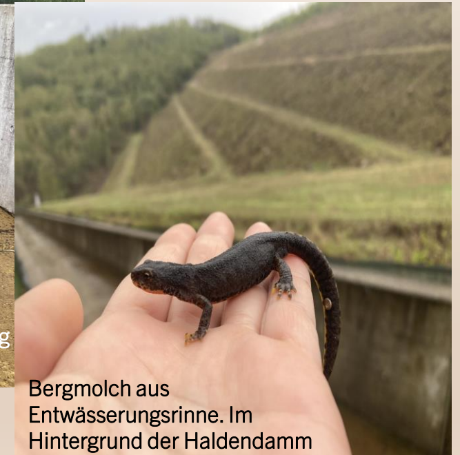
Bergmolch aus Entwässerungsrinne. Im Hintergrund der Haldendamm