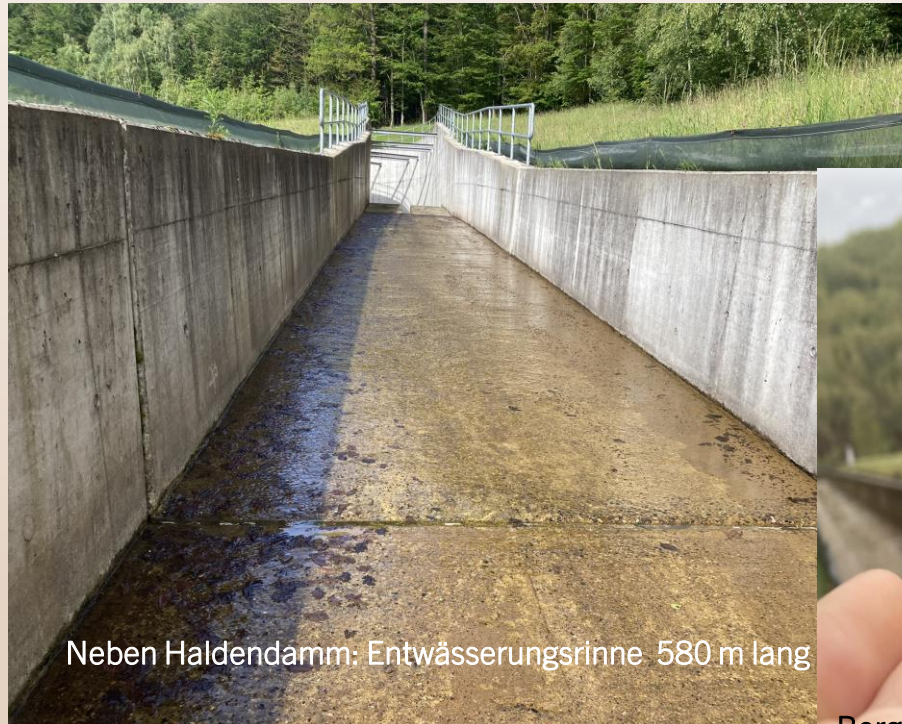
Neben Haldendamm: Entwässerungsrinne 580 m lang