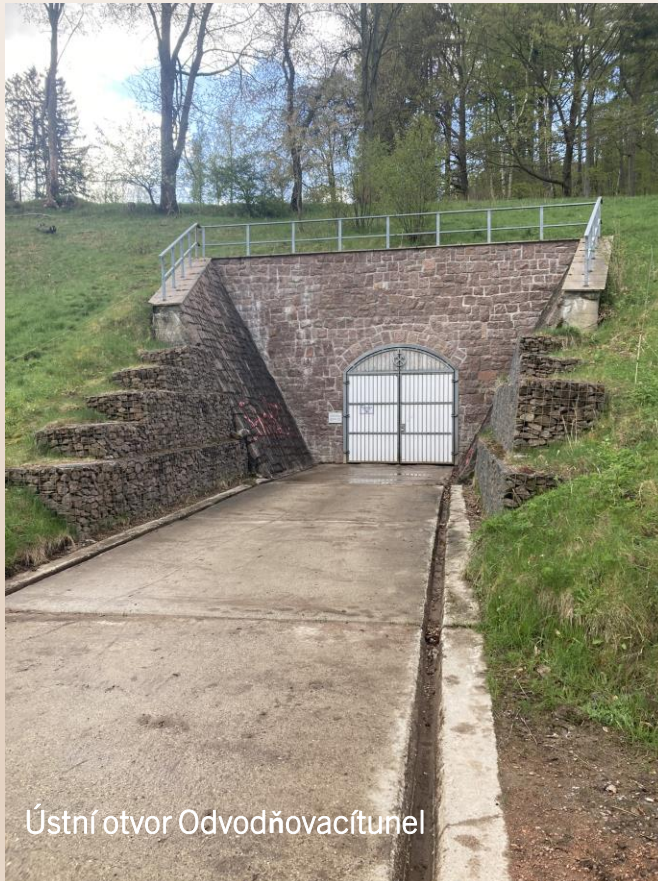
Ústní otvor Odvodňovací tunel