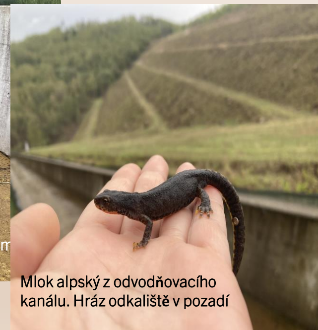
Mlok alpský z odvodňovacího kanálu. Hráz odkaliště v pozadí