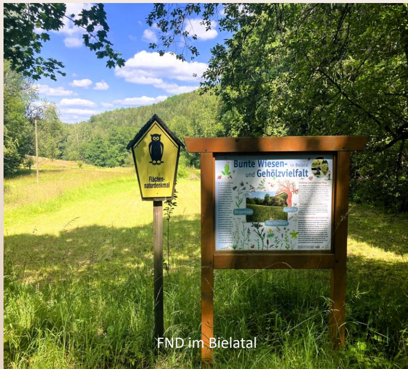
FND im Bielatal