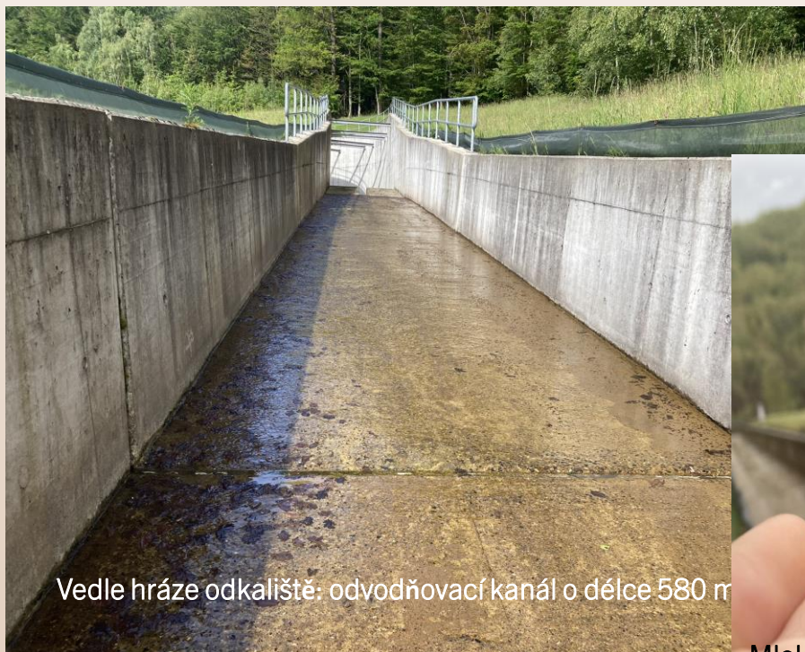
Vedle hráze odkaliště: odvodňovací kanál o délce 580 m